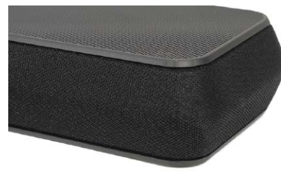
Z przodu oraz z boków maskownice są już tekstylne.