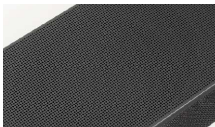
Górny panel wykończono solidną i elegancką, metalową maskownicą.